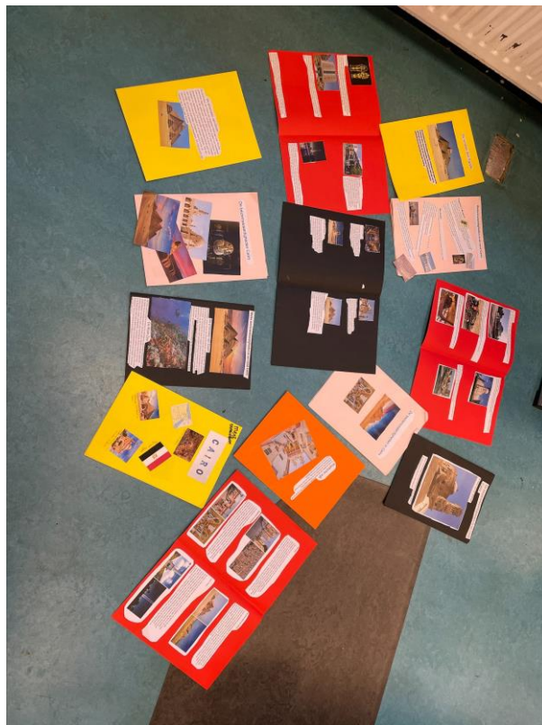
11 - Gemaakte reisgidsen van de ploeterklas