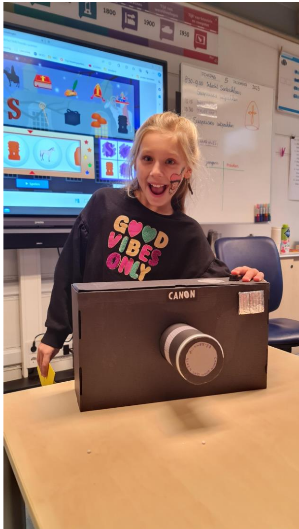
6 - Surprises in 6B