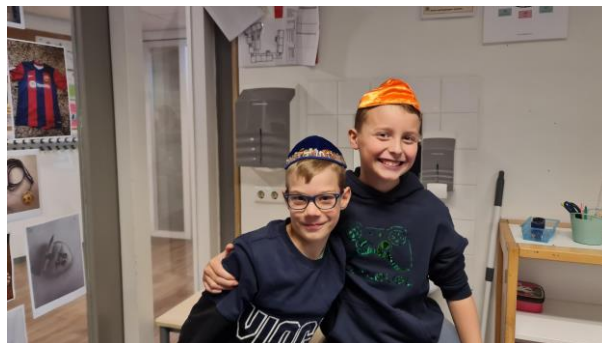
8 - Les over godsdiensten in 6B