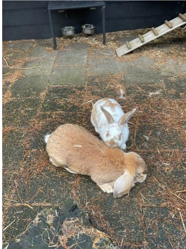
9 - Ouke en Fransje