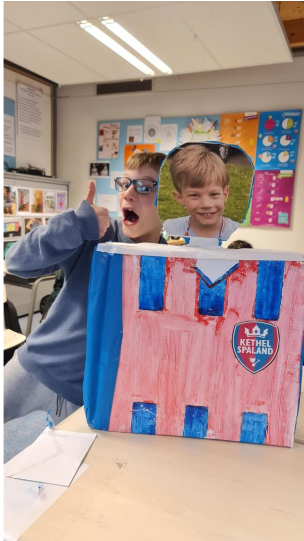
7 - Surprises in 6B