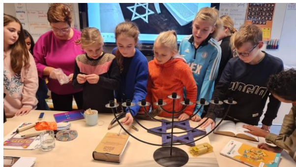
5 - Les over godsdiensten in 6B