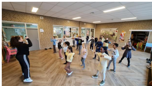
3 - Dansles in 6B