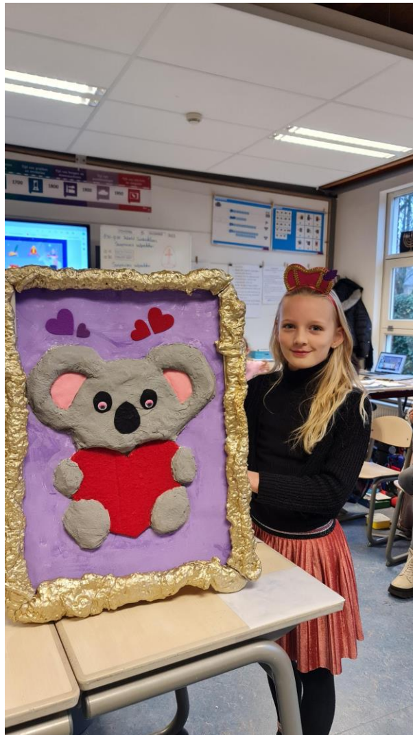
2 - Surprises in 6B

toewerken richting de kerstviering. Nu op naar de kerstvakantie, lekker genieten en vol energie beginnen we straks weer aan 2024!