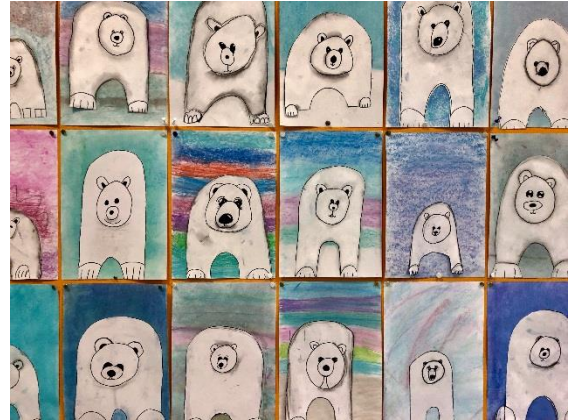
ijsberen gemaakt door groep 6

Groep 6 is afgelopen week op vogelexcursie geweest. In het N.M.E.-centrum stonden er allerlei activiteiten over vogels klaar. Met de microscoop uilenballen bekijken, vogelgeluiden herkennen en reuze ganzenbord bijv. Behalve de binnenactiviteiten mochten de kinderen ook gewapend met een verrekijker naar buiten toe. Het was prachtig weer. In het zonnetje zijn er heel veel vogels gespot: roodborstjes, koolmeesjes, merels en zelfs een specht hebben de kinderen ontdekt. Tijdens de pauze werden de kinderen ook nog 'getrakteerd' op echt voegeleuten: een lekker hapje wormen! Een heleboel stoere kinderen vonden het nog lekker ook. Een beetje nootachtig. Het was een erg leuke en leerzame ochtend.